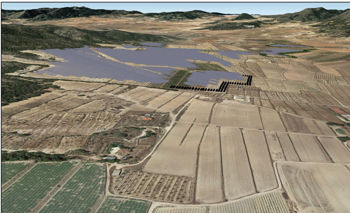
Ilustración 2. Integración paisajística. Detalle.

18. Sugerencias, comentarios y observaciones.