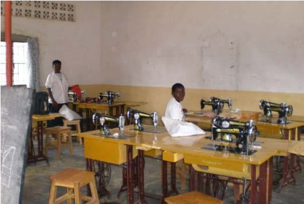
Talleres de costura