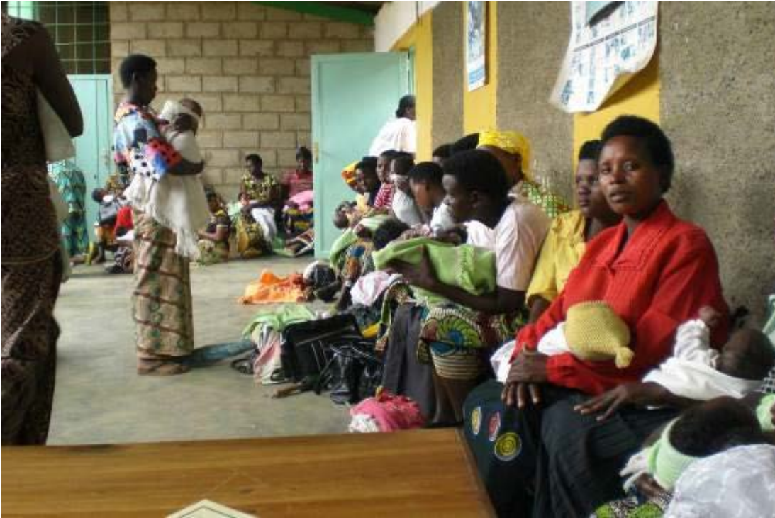
Centro de atención sanitaria y nutricional