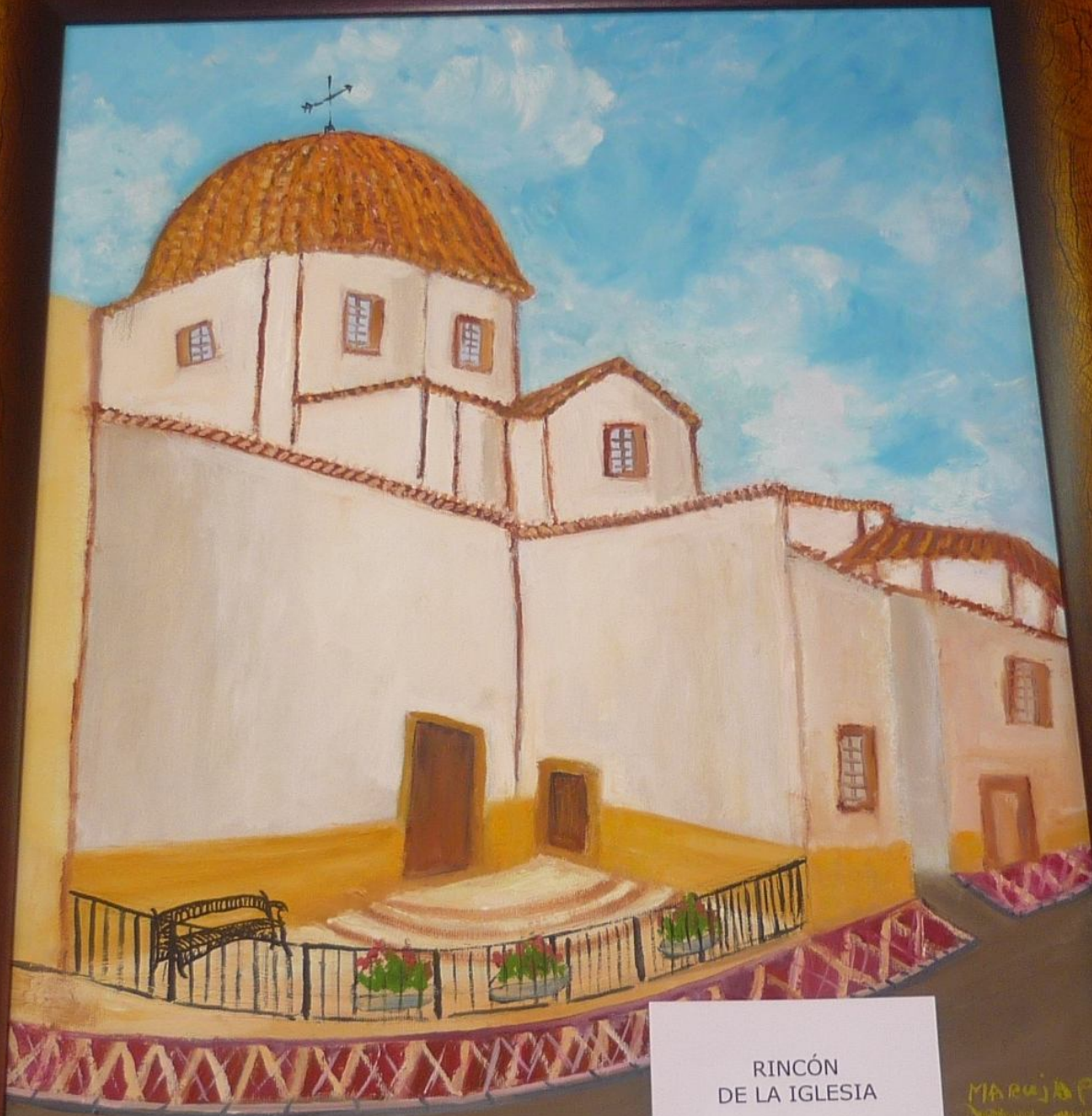
RINCÓN DE LA IGLESIA