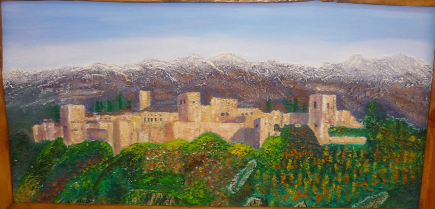
Bouté Francon Valère